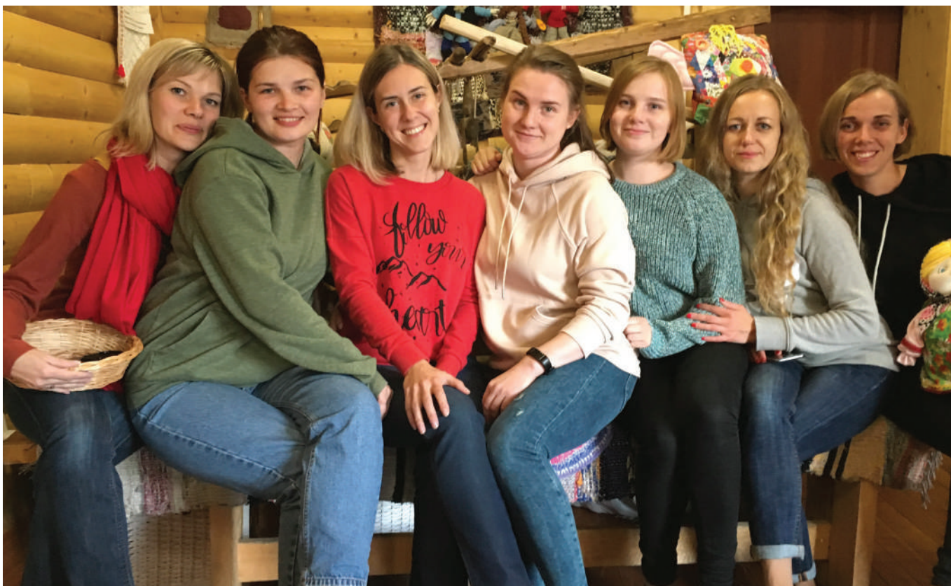
Команда Фонда «Мельница»

Доверие связано с отношениями внутри сообщества и является основой мира, гармонии и процветания. Когда мы обсуждали потенциал ФМС, стало очевидно, что решающими для него являются два типа отношений: участие людей в работе фонда и работа фонда по развитию местных организаций гражданского общества, чтобы реализовывать проекты и программы.