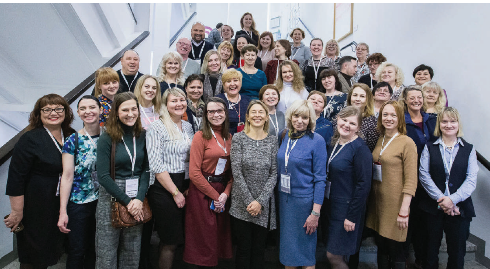
Форум местной филантропии. 20-летие ФМС в России

В настоящее время в России насчитывается около 80 ФМС, и их количество существенно увеличилось с тех пор, как первый фонд был зарегистрирован в 1998 году. Эти события подробно описаны в статье Дженни Ходжсон «Урок дальновидности и терпения: секрет русских фондов местных сообществ» .