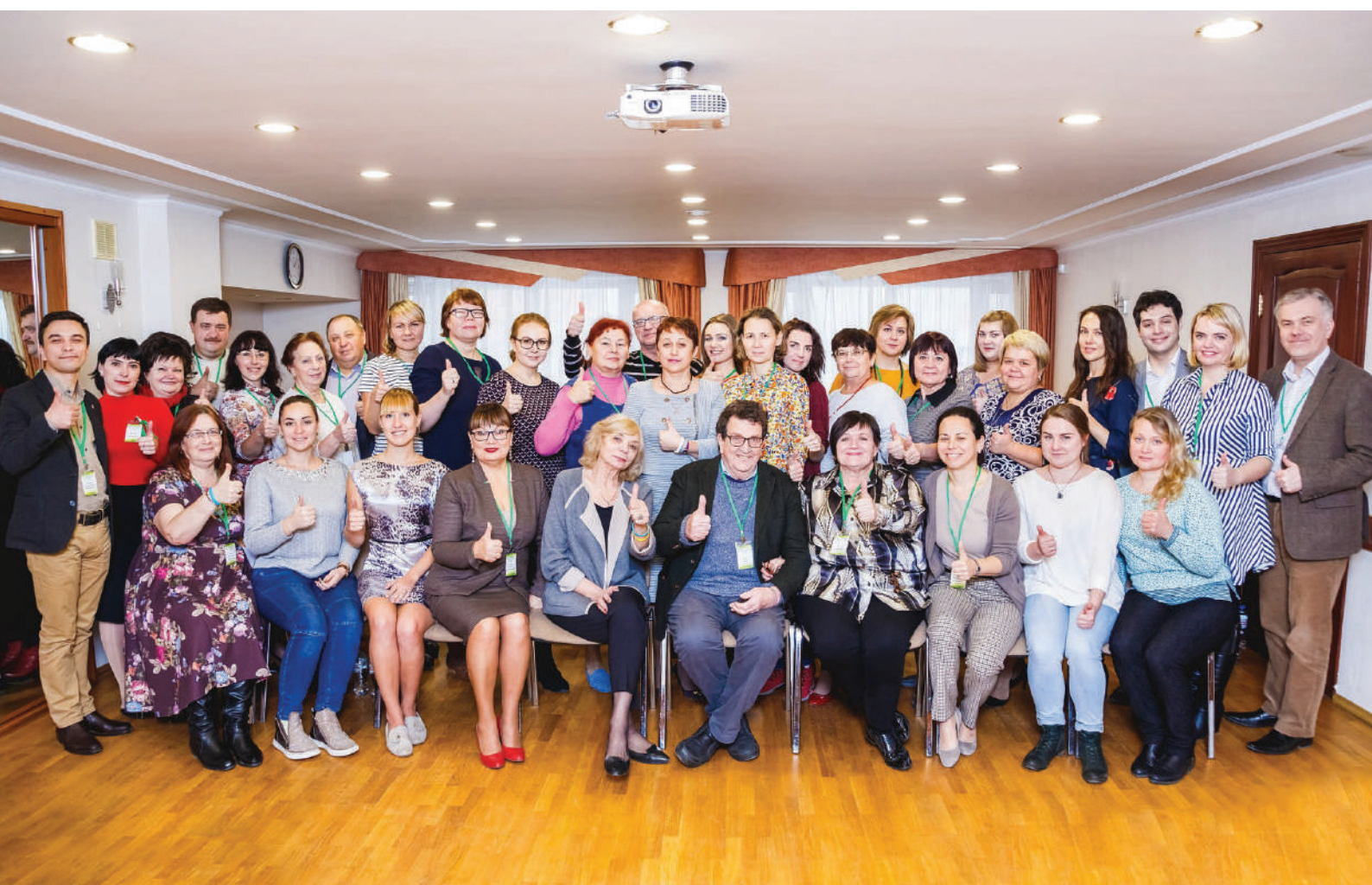
Школа ФМС. Пермь, 2017

«КАФ» впервые представил модель АСТ (Assets-Capacity-Trust) в России в ноябре 2017 года в рамках очередной Школы ФМС в Перми. Модель была представлена на интерактивной сессии, где сами представители ФМС смогли принять участие в ее адаптации и разработке индикаторов для России.